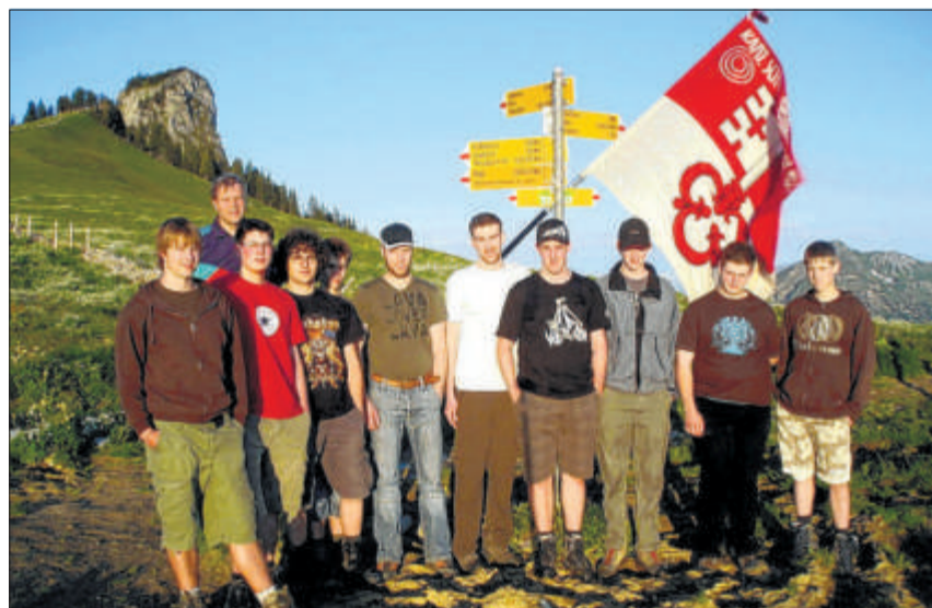
Die Sachsler Jungschützen wanderten mit der traditionellen kantonalen Schützenfahne vom Älggi nach Lungern.