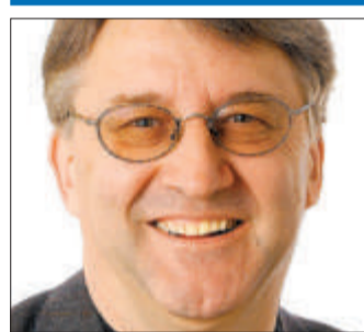
«Damit signalisieren wir, dass wir an den Wohn-, Lebens- und Wirtschaftsraum Uri glauben.»

Weitere Vorkehrungen sind in Bristen und in Andermatt vorgesehen. Die Vorhaben im Urnerental sollen zuletzt die Sicherheit des geplanten Tourismusresorts von Samih Sawiris gewährleisten.