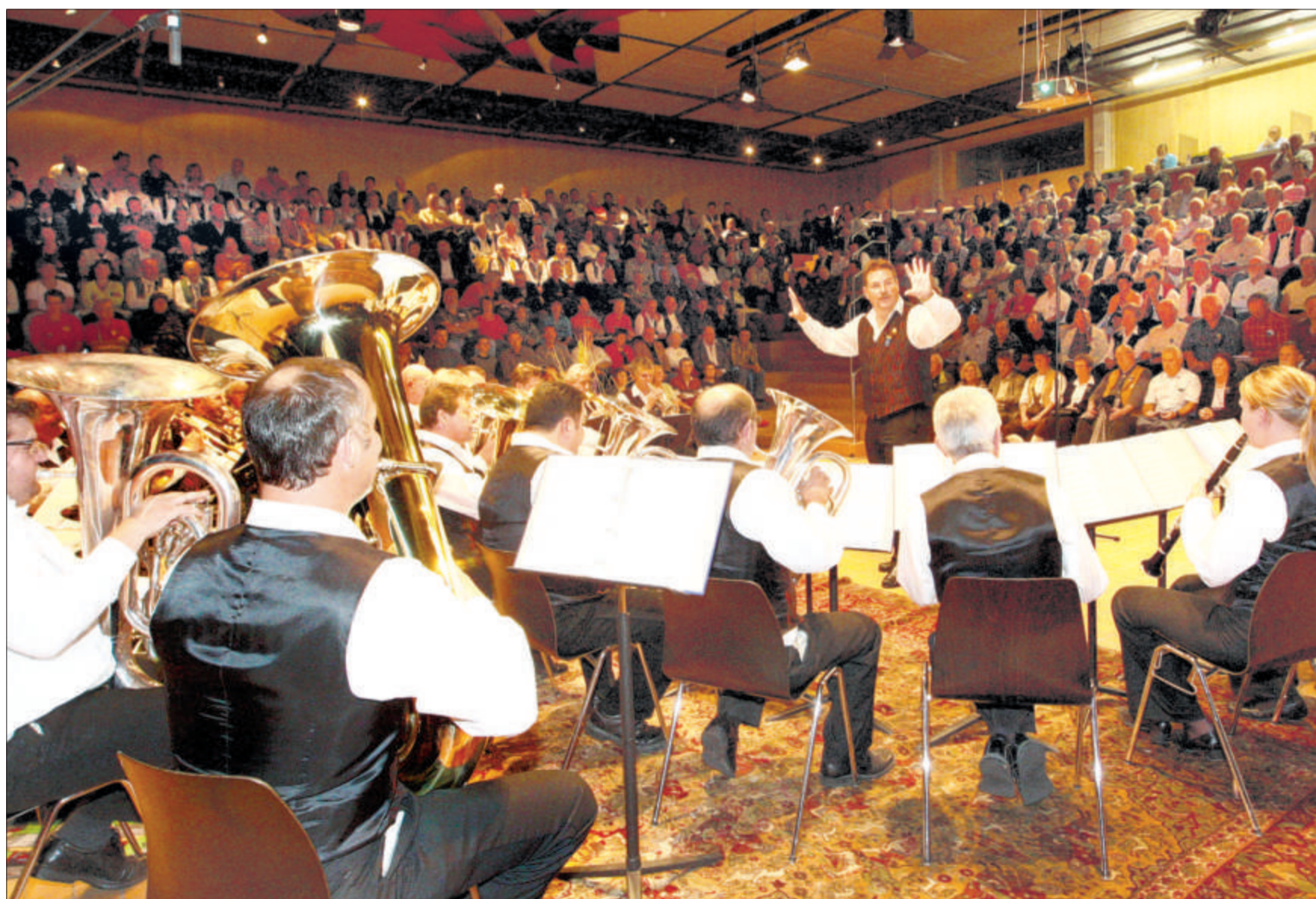
Vor grossem Publikum: die Chüelbachmusikanten aus Schüpfen BE beim Vortrag.

► Die Rangliste finden Sie heute ab 18 Uhr auf www.blaskapellentreffen.ch